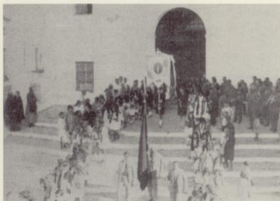
Procesión de impedidos de S. Sebastián. Becerril 1925