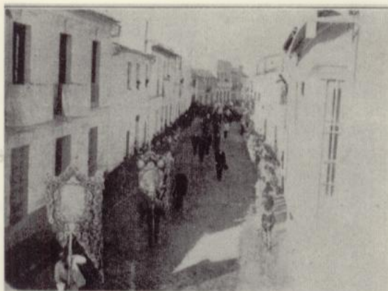
Los simpecados eran portados por personas contratadas para la ocasión.

Escacena, en el que se hacía constar que se hace entrega del presente libro a la hermandad "que ha aparecido entre los papeles y documentos del fallecido mayordomo".