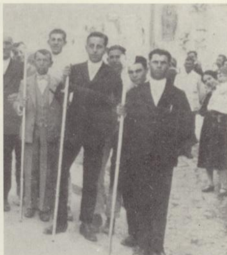
Miembros de la Sacramental con varas, que han procesionado hasta hace muy poco tiempo

Por los gastos de estos años, podemos saber que otro de los ejercicios litúrgicos de la Sacramental era organizar, al menos una vez al año, la Visita de los enfermos, en procesión con S.D.M. apoyado con su guión, estandar-